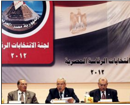
Egito volta a eleições