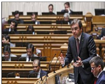
Despedimentos no programa Novas Oportunidades